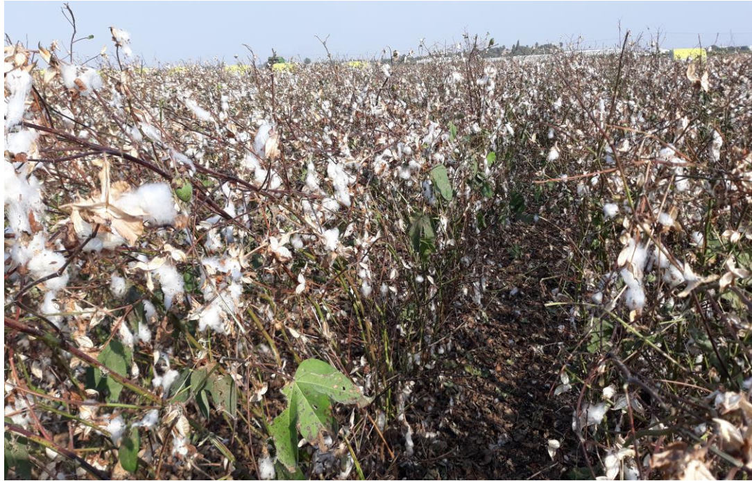
שדה אחרי קטיף \ גובה 180 ס"מ