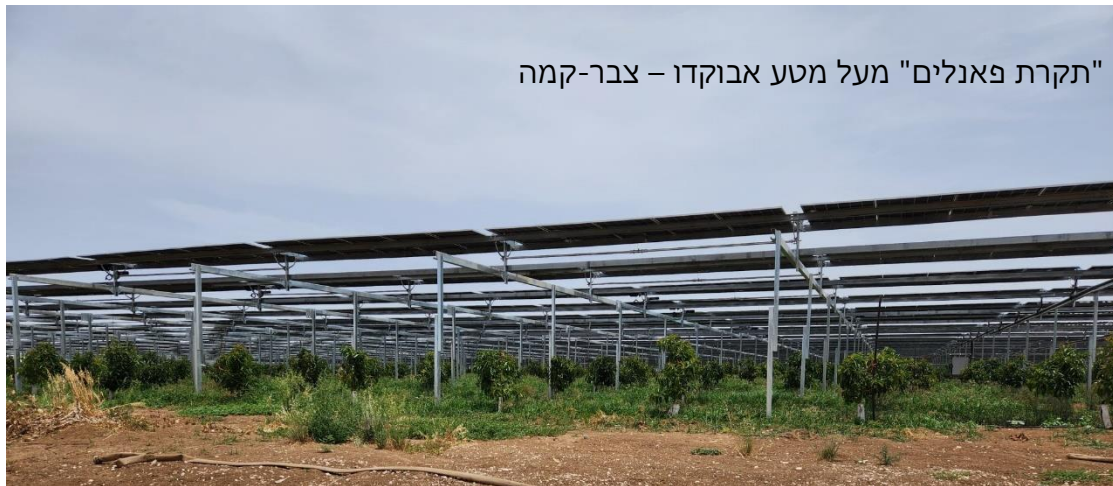
"תקרת פאנלים" מעל מטע אבוקדו – צבר-קמה

אישור תכנית מתאר ארצית לפיתוח מתקנים אגרו-וולטאיים מהווה צעד נוסף בדרך לעצמאות אנרגטית של ישראל. היישום מעלה שורה של אתגרים: "וגר זאב עם כבש"? מה השפעת הצללה על הגידול? איך מיישמים טיפולים שונים במהלך הגידול? וחוק ההתיישבות החקלאית? רשות מקרקעי ישראל הסדירה את ההגדרה לשימוש אגרו-וולטאי ומהם התנאים לקיומו: המשך עיבוד וגידול על קרקע בחוזה ארוך טווח. המתקן הסולרי הוא שכבה נוספת מעל הקרקע החקלאית והפעילות החקלאית תמשך תוך התאמות לשילוב הנדרש. צבר קמה נכנסו לפרויקט האגרו-וולטאי במטע אבוקדו צעיר. בכך נכנס הגד"ש "לעולם תוכן חדש" ומיצוי הפוטנציאל מקרקע חקלאית.