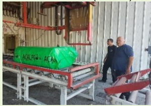
← (בודאות) הכריכה הראשונה