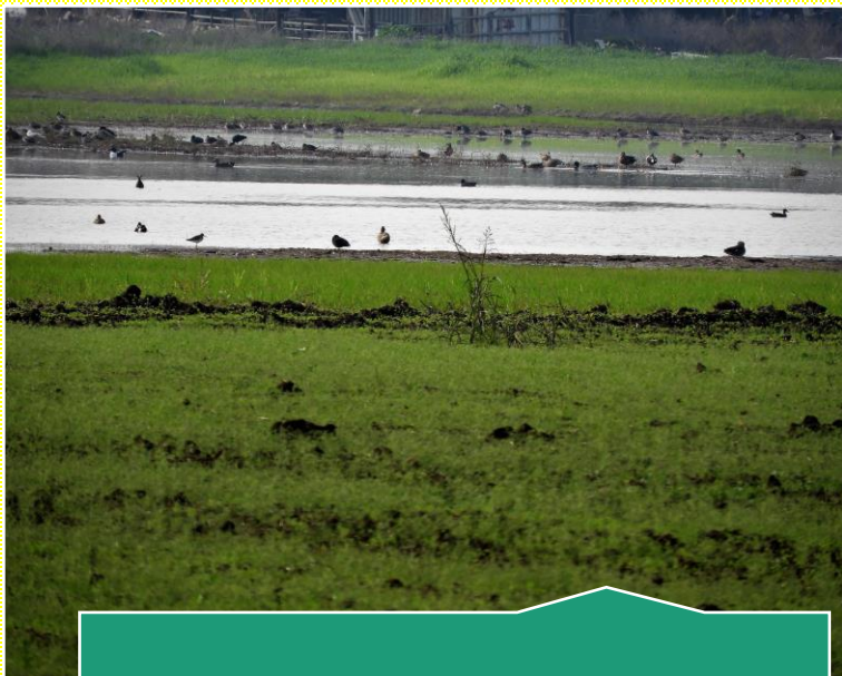
אחרי 350 מ"מ גשם. עדיין בריכות מים בשדה.