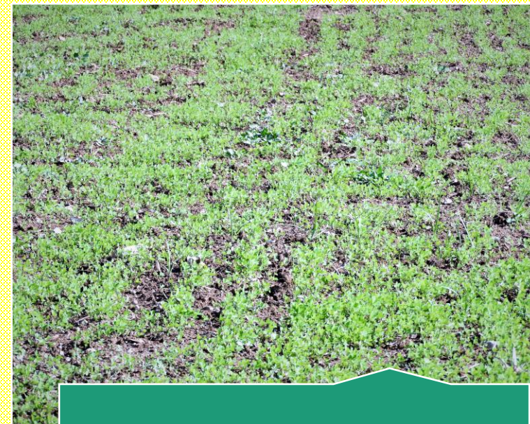
3 ינואר תלתן בקיה מקורב

בקעת לוד, אדמה חרסיתית כבדה. כרב חיטה. עיבוד דיסק. הצנעת 5 יחידות זרחן (סופרפוסטט). תחילת נובמבר גשם עוצמתי 150 מ"מ. בתחילת דצמבר החלקות משובשות במגוון עשבים. מתן ראודאפ + אור להדברה. וקלטור למצע זרעים. מפאת חוסר בכוח אדם, לזריעה כפולה בטורית. החליט המגדל לפזר את זרעי התלתן במדשנת צנטרפוגלית. ואת הבקיה זריעה בטורית. כך שהטורית הצניעה את זרעי התלתן. לאחר גשמי דצמבר החלה נביטה. פשוט פיזור מדהים. הכמויות – 4 ק"ג דונם בקיה פופני + 1.5 ק"ג דונם תלתן תבור.